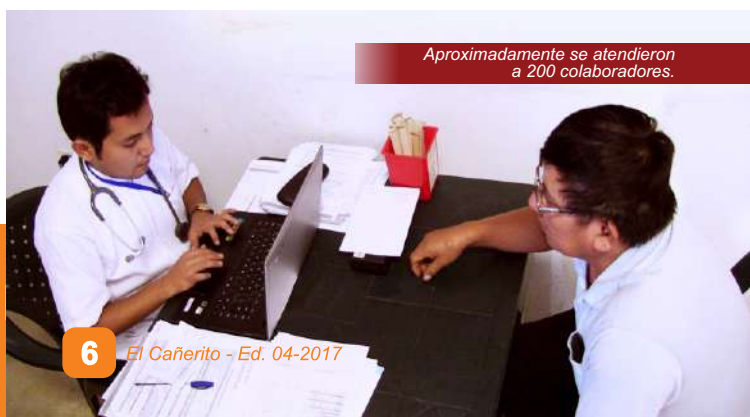
Aproximadamente se atendieron a 200 colaboradores.

Los trabajadores acudieron al Centro de Esparcimiento para iniciar con la jornada de atenciones médicas en los consultorios de tóxico, audiometría, espirometría, electrocardiograma, rayos X, psicología y medicina general; con la finalidad de estar en óptimas condiciones físicas y psicológicas para el buen desempeño de sus funciones.