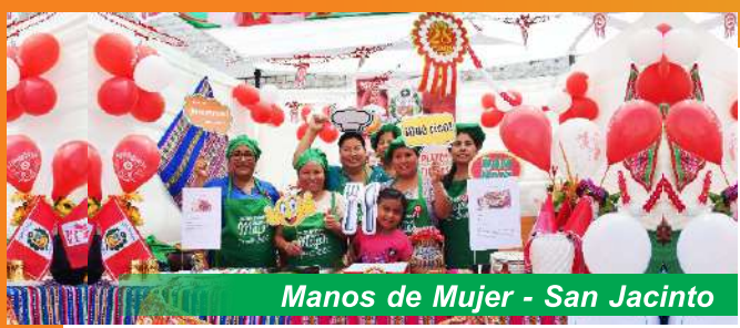
Manos de Mujer - San Jacinto