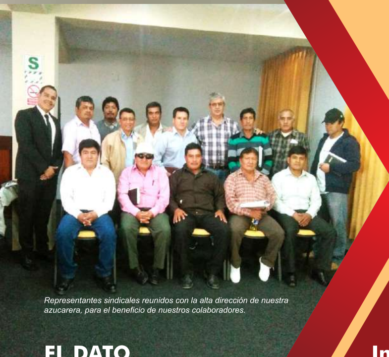
Representantes sindicales reunidos con la alta dirección de nuestra azucarera, para el beneficio de nuestros colaboradores.